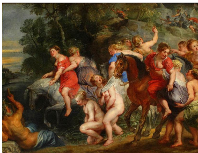
Peter Paul Rubens: Cloelia überquert den Tiber (1630-1640)

Marcia, die Tochter des Historikers Cremutius Cordus, trauert um ihr verstorbenes Kind. In seiner Trostschrift an Marcia betrachtet der Philosoph Seneca die Entwicklung dieser Trauer und gibt Anregungen, über den Verlust des Sohnes hinwegzukommen. Dabei spricht er von der Seelenstärke der Frau (Seneca, De Consolatione ad Marciam ).